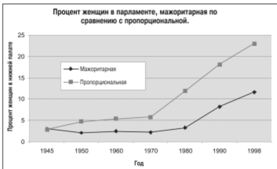
Рис. 3.2 Процент женщин в парламенте. Сравнение мажоритарной системы с пропорциональной системой