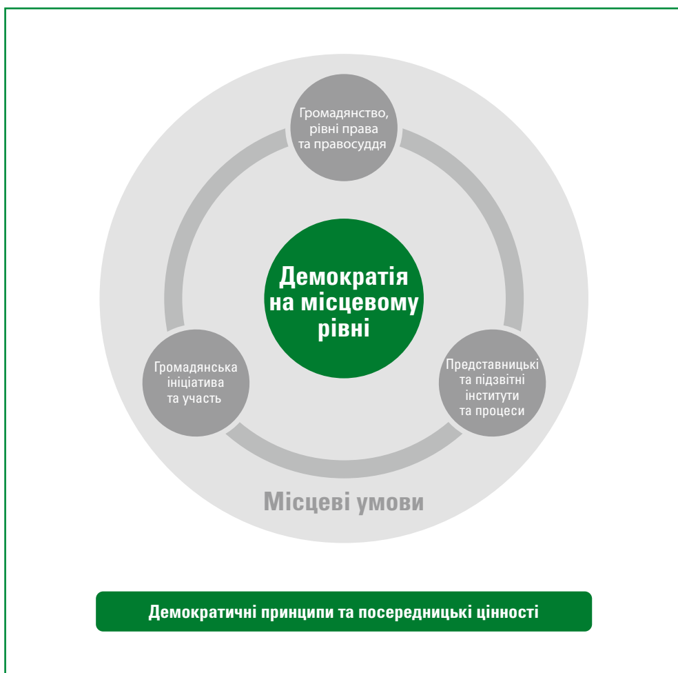
Діаграма 2.1. Візуальне представлення системи оцінювання стану демократії на місцевому рівні

Аналіз завжди повинен базуватися на розгляді місцевої ситуації та черпати інформацію з місцевого контексту, оскільки саме так створюється перспектива для розгляду доказів, отриманих в результаті оцінювання. Принципи та посередницькі цінності завжди лежать в основі системи та відображаються у запитаннях для проведення оцінювання.