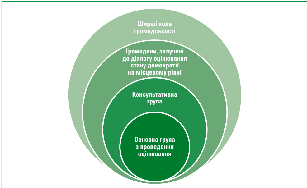
Діаграма 3.2. Рівні залучення громадян

У групі з проведення оцінювання та консультативній групі представництво жінок та чоловіків, що володіють необхідними професійними навичками та досвідом, має бути однаковим.