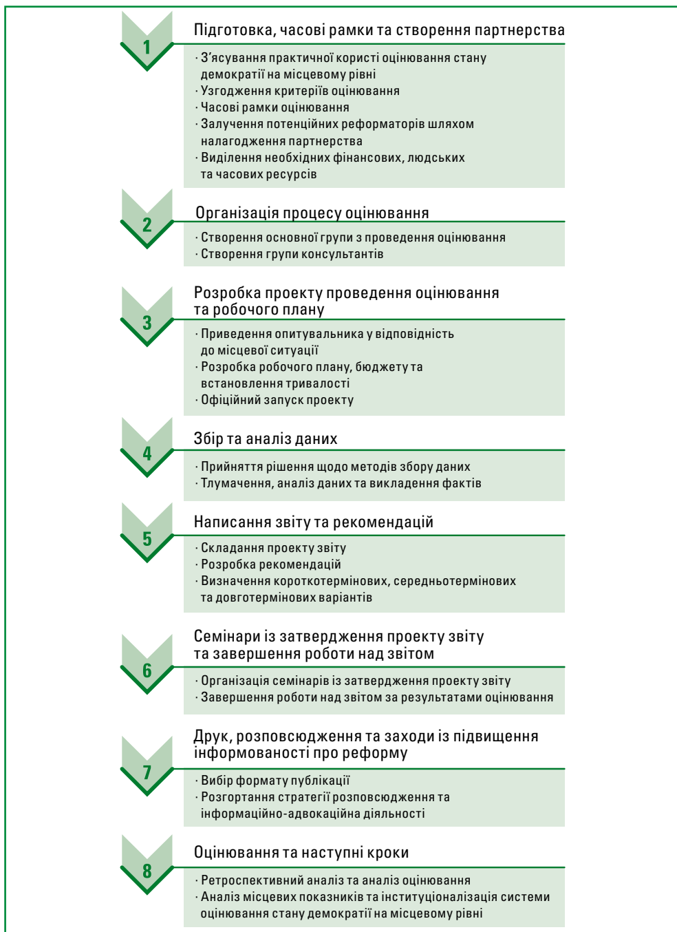
Діаграма 3.1. Етапи оцінювання

Нижче стисло викладено основні етапи та рішення, поділені на вісім послідовних кроків. Такий поділ має на меті забезпечити належну підготовку, реалізацію та контроль за виконанням оцінювання.