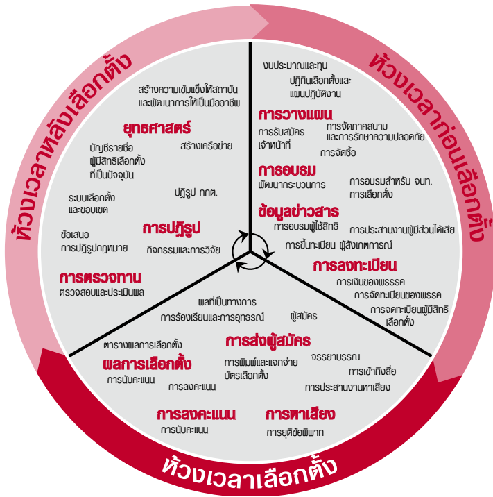
ภาพที่ 2 วัฏจักรการเลือกตั้ง

เพื่อที่จะออกแบบ รชต. อย่างเหมาะสม และนำไปใช้อย่างครอบคลุมและได้ผล จำเป็นต้องคำนึงถึง 3 ช่วงของวัฏจักรการเลือกตั้ง คือช่วงเวลาก่อนเลือกตั้ง ระหว่างเลือกตั้ง และหลังเลือกตั้ง การพิจารณานี้มีความสำคัญ เพราะกิจกรรมแทบทุกกิจกรรมของกระบวนการเลือกตั้งอาจนำไปสู่การร้องคัดค้านได้ ถ้า รชต. ไม่มีอำนาจทรัพยากรและเครื่องมืออันเพียงพอที่จะสนองตอบอย่างมีประสิทธิภาพและประสิทธิผลตลอดทั้งวัฏจักรการเลือกตั้ง กระบวนการเลือกตั้งอาจตรวจและผลการเลือกตั้งอาจถูกปฏิเสธได้