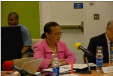
Geraldine Fraser-Moleketi女士，联合国开发计划署发展政策局(BDP)民主治理小组主任