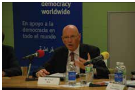
结束和总结: Roland Rich先生，联合国民主基金行政负责人