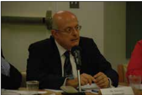
Massimo Tommasoli博士, 國際IDEA常駐聯合國觀察員