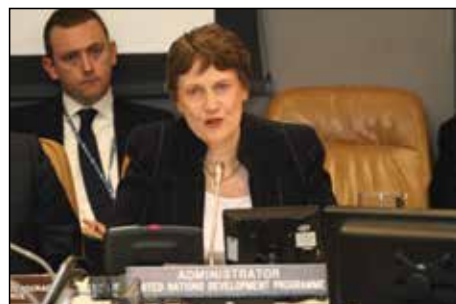
Г-жа Хелен Кларк, Администратор ПРООН