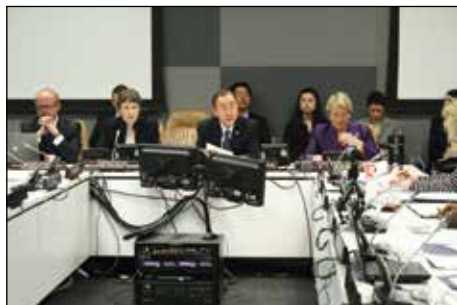
Вступительные замечания: г-н Видар Хельгесен, Генеральный секретарь ИИДЕА (слева), г-жа Хелен Кларк, Администратор ПРООН (в центре слева), г-н Пан Ги Мун, Генеральный секретарь ООН (в центре справа), г-жа Мишель Башле, Исполнительный директор Структуры «ООН-женщины» (справа)