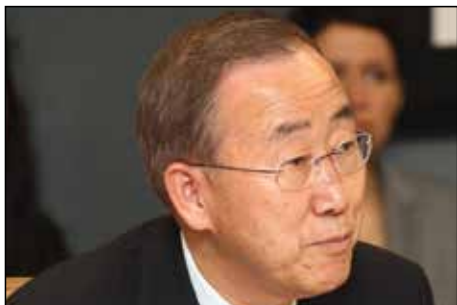
Г-н Пан Ги Мун, Генеральный секретарь ООН