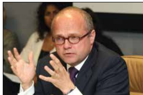
Г-н Видар Хельгесен, Генеральный секретарь ИИДЕА