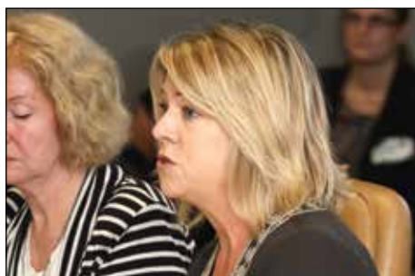
Г-жа Шари Брайан, вице-президент Национального демократического института, Соединенные Штаты Америки