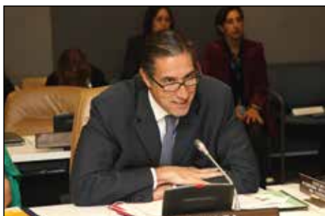
Вступительное слово: г-н Оскар Фернандес-Таранко, помощник Генерального секретаря ООН