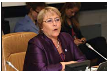
Г-жа Мишель Башле, Исполнительный директор Структуры «ООН-женщины»