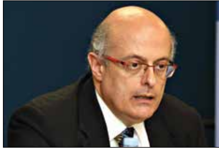
Д-р Массимо Томмазоли, постоянный наблюдатель ИИДЕА при ООН