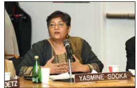
Г-жа Ясмин Соока, директор Фонда поддержки прав человека, Южная Африка