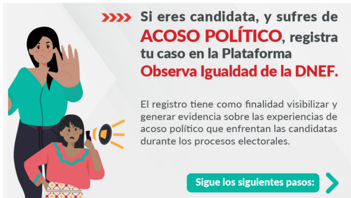
Figura 2. Captura de pantalla de la Plataforma Observa Igualdad del JNE para acoso político