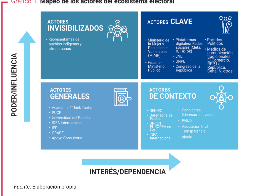
Gráfico 1. Mapeo de los actores del ecosistema electoral

El mapeo de actores realizado para el estudio de caso de Perú revela un ecosistema electoral diverso, con niveles desiguales de compromiso, influencia y capacidad operativa frente a los cuatro ejes temáticos clave: integridad electoral, digitalización de procesos, desinformación y violencia digital de género en política.