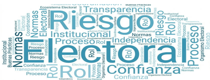
Figura 3. Palabras más usadas sobre factores político-institucionales

Respecto de los factores político-institucionales que afectan la integridad electoral en Perú, vemos que las palabras que más se repitieron durante las entrevistas realizadas fueron “riesgo”, “electoral”, “confianza” y “normas”.