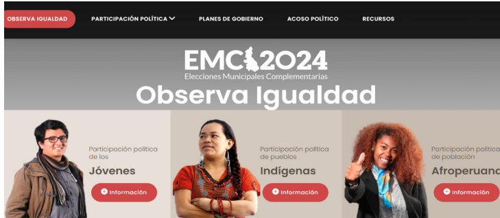
Figura 1. Captura de pantalla de la Plataforma Observa Igualdad del JNE